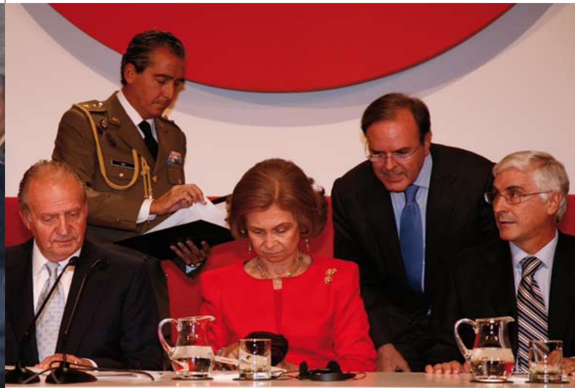
Página posterior. Durante la ceremonia de entrega del Premio se interpretaron piezas de Bach, Vivaldi y Bizet, entre otros.