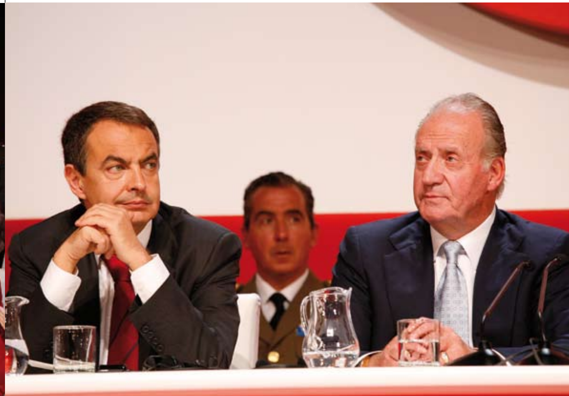
Derecha. El presidente del Gobierno, José Luis Rodríguez Zapatero, y S.M. el Rey de España durante la ceremonia de entrega del Premio.