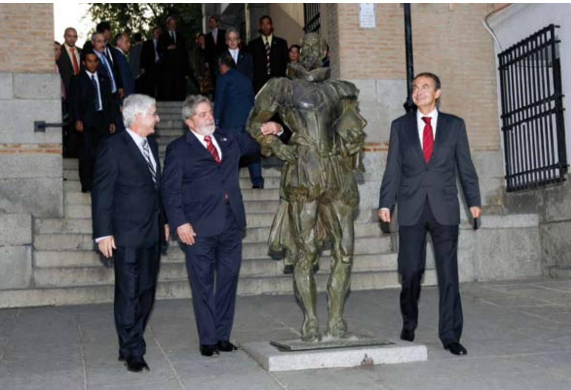
Página anterior. Fachada del Museo de Santa Cruz de Toledo, minutos antes del comienzo de la ceremonia de entrega del Premio Internacional Don Quijote de La Mancha.