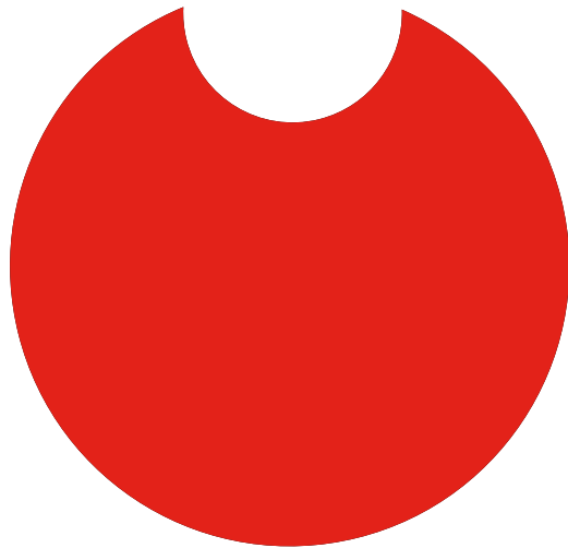
El logo del Premio Internacional Don Quijote de La Mancha ha sido diseñado por Manuel Estrada.