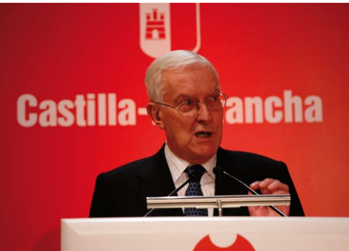
Izquierda. Víctor García de la Concha, director de la Real Academia Española. Derecha. Juan Luis Cebrián, periodista y miembro de la Real Academia Española.