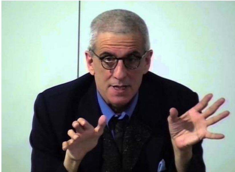
David Rieff, analista político, periodista y crítico cultural

(Boston, 1952), licenciado en historia por la Universidad de Princeton, es analista político, periodista y crítico cultural estadounidense. Sus artículos se han publicado en importantes medios, como The New York Times , The Washington Post , The Wall Street Journal , Le Monde , The Atlantic Monthly , Foreign Affairs o El País . Es hijo de Susan Sontag.